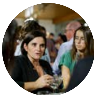
Soirée des mécènes